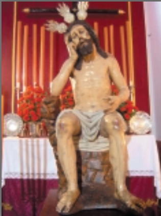
“Cristo de la Humildad y Paciencia de Jerez, antiguo titular de la Hermandad Gaditana. ”.