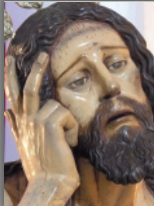
“Detalle de la cabeza del Cristo de la Humildad y Paciencia de Jerez.”.