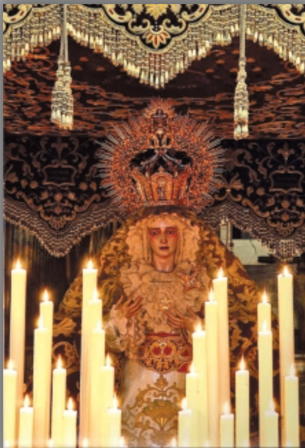
“Nuestra Señora de la Amargura.”.

El domingo 27 de Noviembre tuvo lugar una peregrinación y convivencia en el Santuario Mariano de Ntra. Sra. de la Luz en Tarifa. Iniciándose el trayecto en el barrio de la Viña ante Nuestra Señora de la Palma Coronada y continuando la jornada con el rezo del ángelus ante Ntra. Sra. de la Oliva de Vejer.